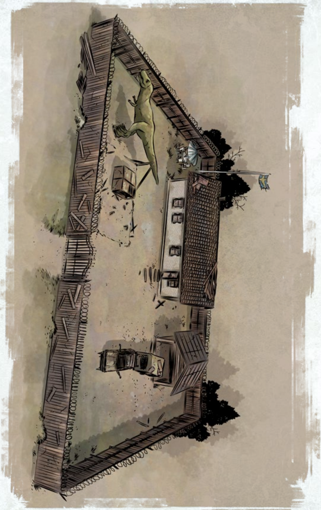
SPIELERKARTE 4: DAS FAMILIENGEHÖFT