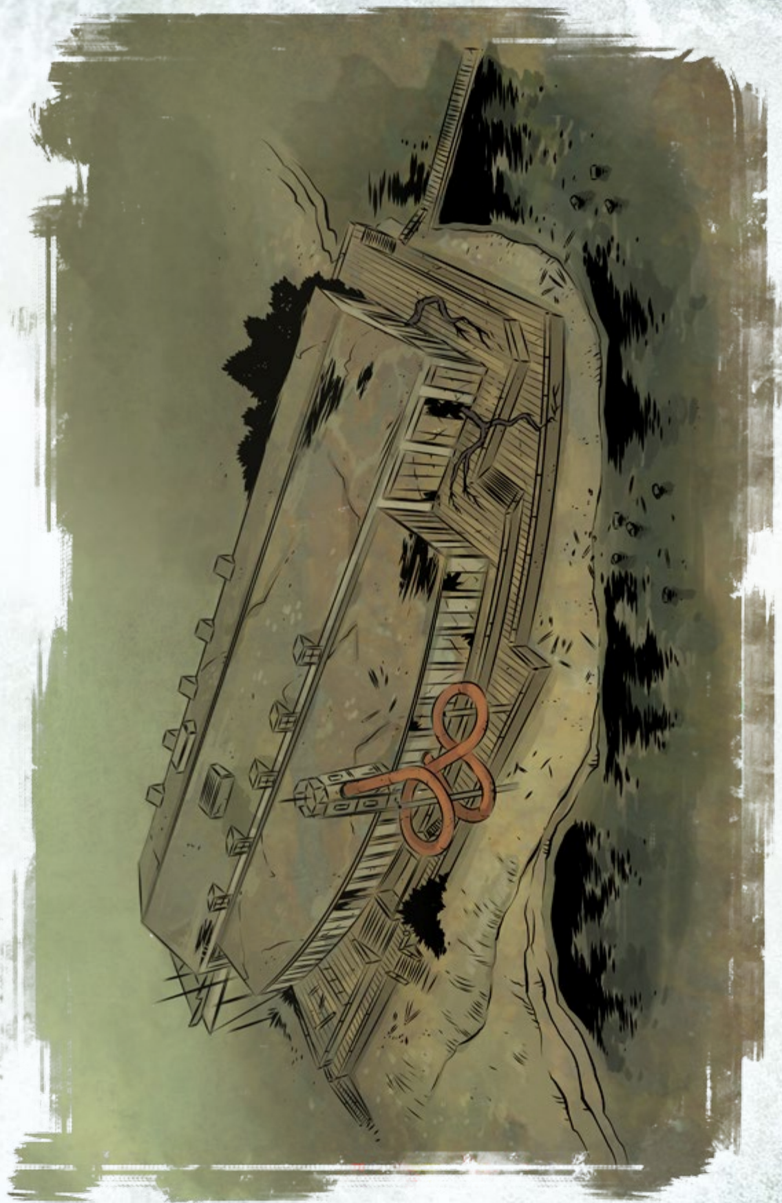
SPIELERKARTE 3: DAS VERLASSENE SCHWIMMBAD