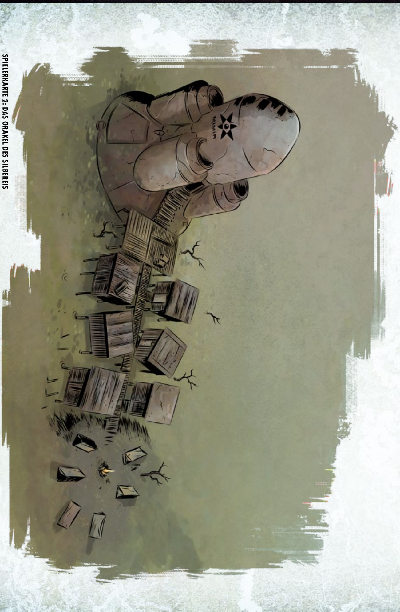
SPIELERKARTE 2: DAS ORAKEL DES SILBEREIS