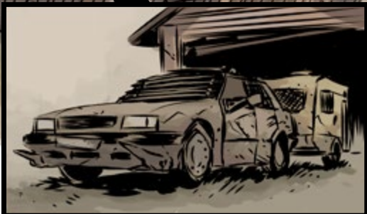
AUTO &amp; WOHNWAGEN