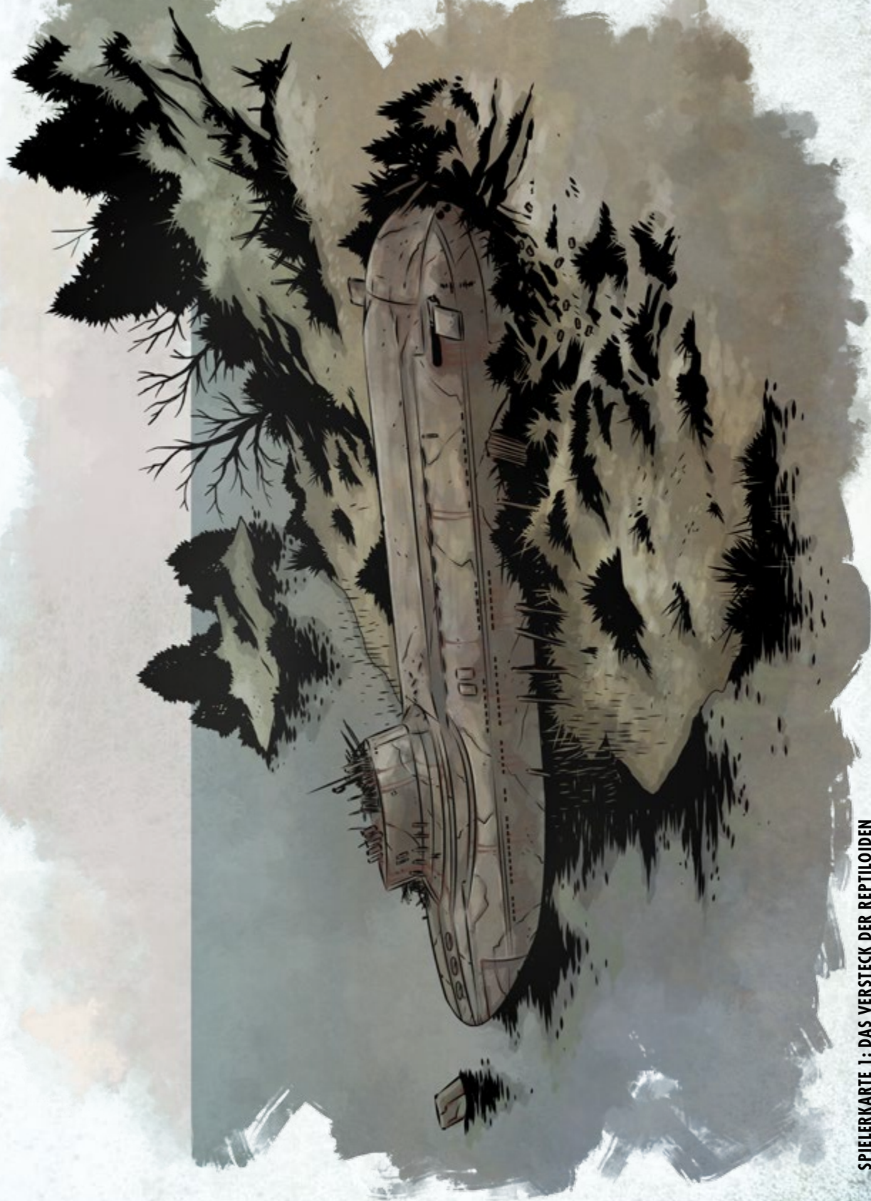
SPIELERKARTE 1: DAS VERSTECK DER REPTILOIDEN