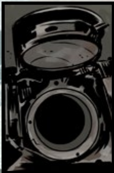
LUKE ZUR BRÜCKE